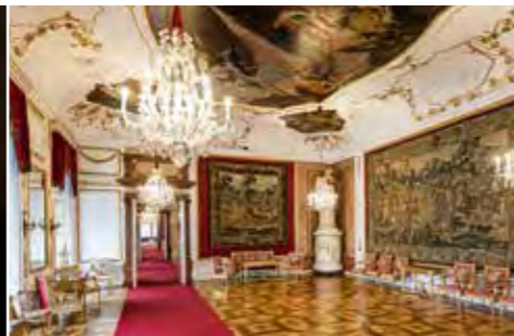
Audienzzimmer, Residenz zu Salzburg