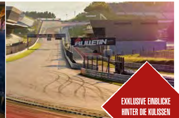
Red Bull Ring Tour