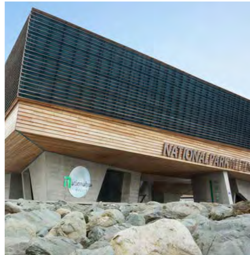
Nationalparkzentrum Hohe Tauern

Der Nationalpark Hohe Tauern ist eine der spektakulärsten Naturlandschaften der Erde. Seine Geschichte und Geschichten zu erzählen, haben sich die Nationalparkwelten in Mittersill zum Ziel gesetzt.