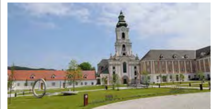
Stift Wilhering © Stiftshof mit Kirche

Entdecken Sie die faszinierenden Hintergründe der Stiftskirche, des Klosters und des Kreuzgangs bei einer einzigartigen Führung, die Ihnen neue Perspektiven eröffnet.