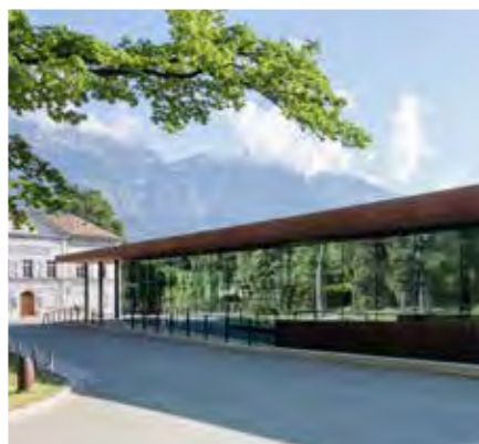
Das Tirol Panorama am Bergisel

Wow-Effekt im Riesenrundgemälde am Bergisel