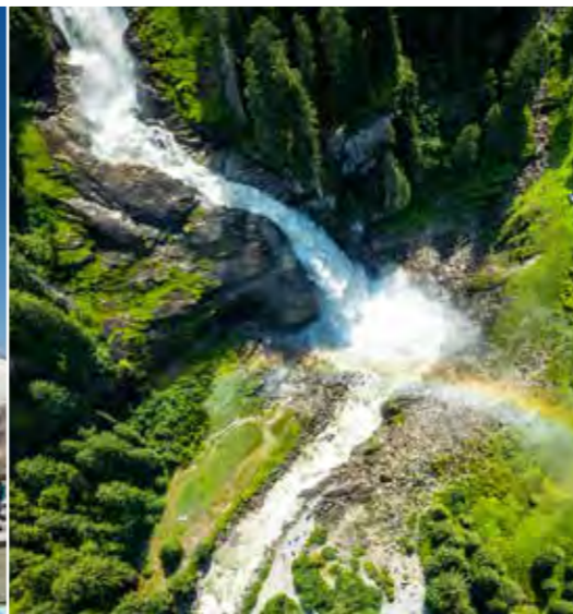
Krimmler Wasserfälle von oben

Zweifellos ist die Großglockner Hochalpenstraße eine der schönsten Panoramastraßen der Welt – nicht umsonst gehört sie zu den drei meistbesuchten Ausflugszielen Österreichs und steht seit 2015 unter Denkmalschutz! Auf einer Länge von 48 Kilometern führt sie von Kärnten oder von Salzburg hinein ins Herz des Nationalpark Hohe Tauern.