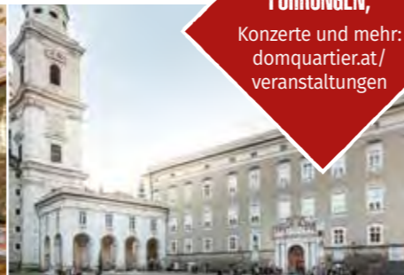
DomQuartier Salzburg, Residenzplatz

FÜHRUNGEN, Konzerte und mehr: domquartier.at/ veranstaltungen