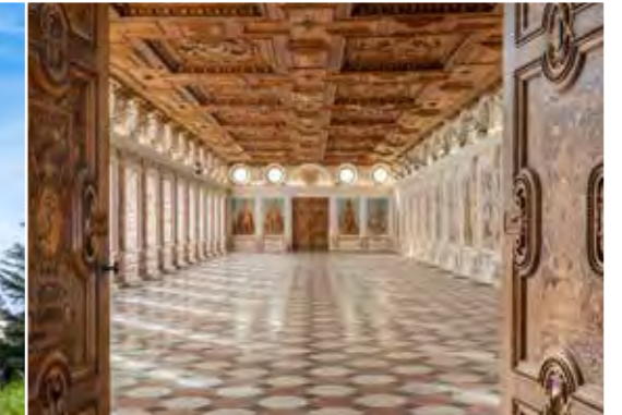
Der einzigartige Spanische Saal

Schloss Ambras Innsbruck ist eine der schönsten Sehenswürdigkeiten Österreichs. Das Renaissanceschloss war ein Geschenk aus Liebe von Erzherzog Ferdinand II. an die nicht standesgemäße Philippine Welser. In einem eigenen Museumsbau seine zahlreichen, außergewöhnlichen und teils exotischen Kostbarkeiten unter. Das erste