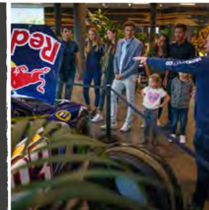
Red Bull Ring Tour

Die 90-minütige Red Bull Ring Tour bringt dich an Orte, die dir als Fan normalerweise verborgen bleiben, wie die Race Control, das Media Center und die VIP-Lounges.