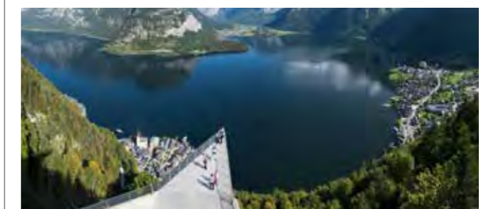
Skywalk mit See

In den Salzwelten Hallstatt erlebt man spannend und unterhaltsam 7000 Jahre Salzabbau. Die Fahrt mit der Salzbergbahn, die spektakuläre Aussichtsplattform „Welterbeblick“ und ein begehbares Schaugrab bilden den Anfang. Bei der Tour durch das Salzbergwerk begeistern 2 lange Bergmannsrutschen, der unterirdische Salzsee und das Bronzezeit-Kino. Entdecke die Arbeit der Archäolog*innen des Natur-