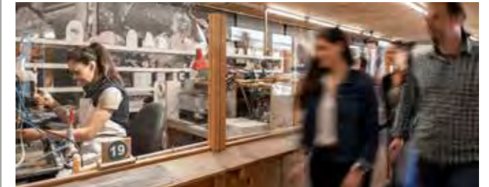
Gläserne Fabrik

Hier wird vorwiegend steirisches Gestein zu einzigartigen Werk- und Schmuckstücken verarbeitet. Verfolgen Sie die Veredlung Schritt für Schritt und erfahren Sie Wissenswertes über die Verarbeitung von regionalen Natursteinen bei einer Führung durch die Gläserne Fabrik. Mit Edelsteinschleiferei, Künstleratelier, Goldschmied, Steinbildhauer und Glitzerwelt der Kristalle präsentiert sich die Manufaktur als ein beliebtes Ausflugsziel für Familien und Reisegruppen. Wissens- und