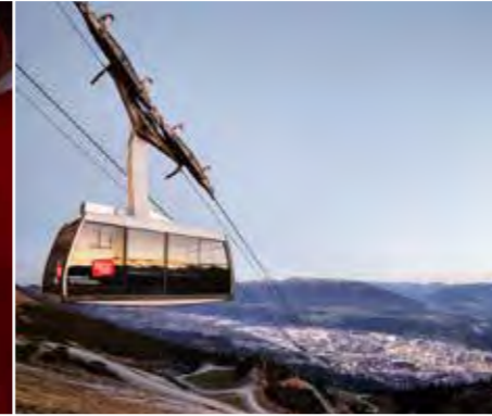
Nordkette 2024

DIE SWAROVSKI KRISTALLWELTEN EIN ERLEBNIS FÜR ALLE SINNE Die Swarovski Kristallwelten wurden im Jahr 1995 anlässlich des hundertjährigen Firmenjubiläums eröffnet. Der Multimediakünstler André Heller entwarf damit einen einzigartigen Ort der Fantasie.