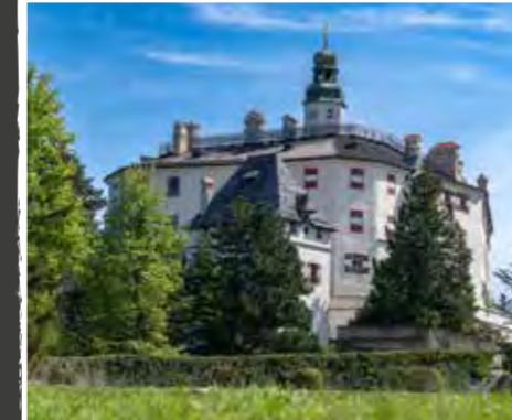
Ein Schloss. Viele Geschichten

Sonderausstellung »The Art of Beauty« von 18. Juni bis 05. Oktober 2025