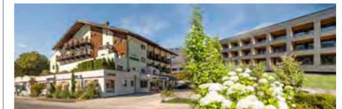
Historische Gaststätte mit 5 urigen Gasträumen

Ein Mix aus Tradition und Moderne im 4**** Hotel DER RESCHENHOF! Der Reschenhof punktet mit seiner idealen Lage zwischen der Landeshauptstadt Innsbruck, mit ihren zahlreichen Sehenswürdigkeiten wie dem Goldenen Dachl und unzähligen Einkaufsmöglichkeiten, und der Marktgemeinde Wattens, mit den bekannten Swarovski Kristallwelten. Das Hotel bietet 71 traditionell gemütliche Zimmer und 36 nachhaltig moderne Gartensuiten an. Der 300m 2 große Wellnessbereich, das 25-Meter-Sportbecken im