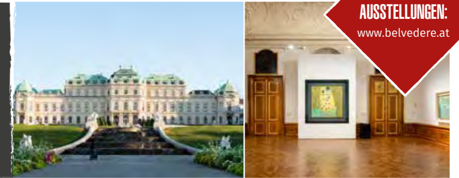
Oberes Belvedere

Cézanne, Monet, Renoir. Französischer Impressionismus aus dem Museum Langmatt 25. September 2025 – 08. Februar 2026