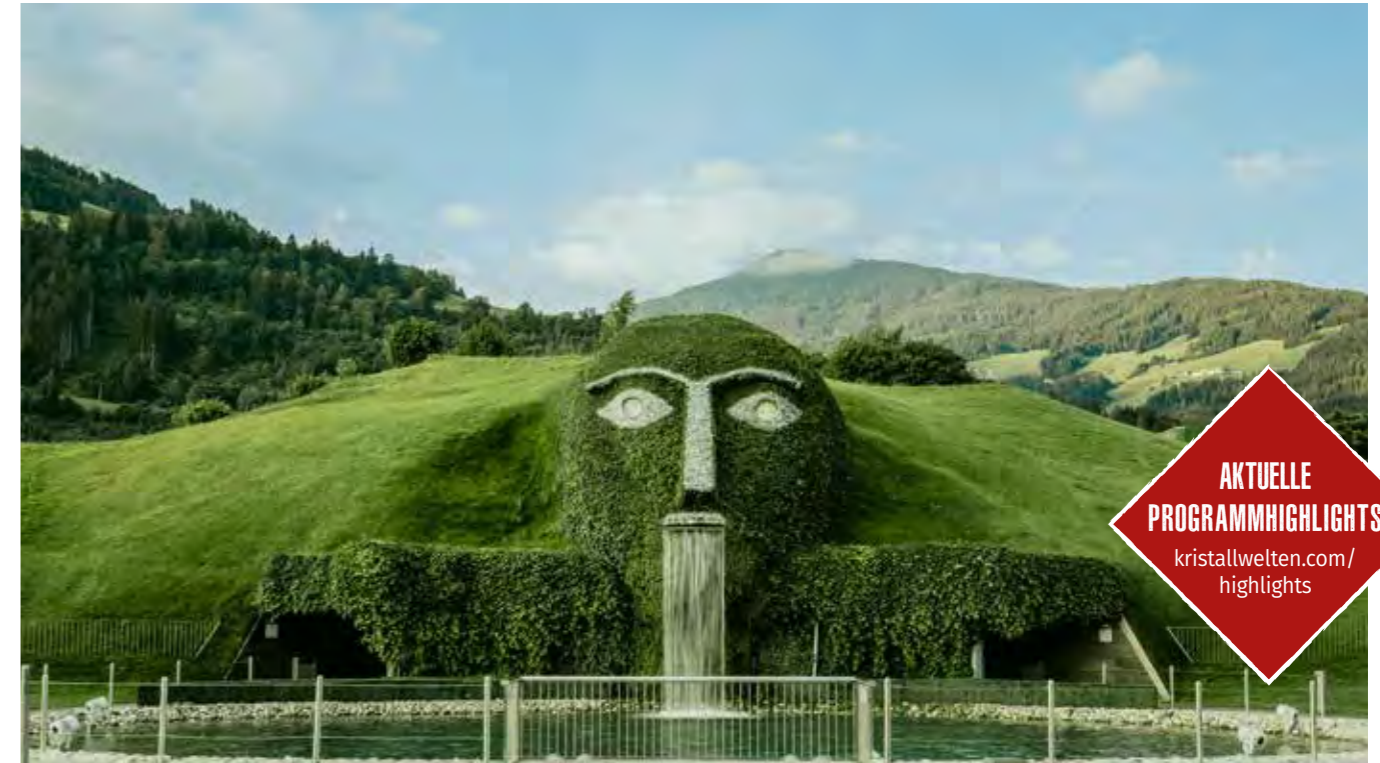
Die Swarovski Kristallwelten zählen zu den meistbesuchten Sehenswürdigkeiten Österreichs.

Erleben Sie die einzigartige Mischung aus Kunst und Kultur, Shopping, Kulinarik und Familienerlebnis in Wattens, Tirol.