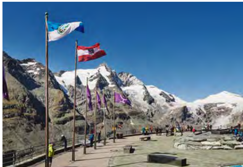
Großglockner Hochalpenstraße, Kaiser-Franz-Josefs-Höhe

Warum Österreichs schönste Panoramastraße das ideale Ausflugsziel für Busreisen ist?