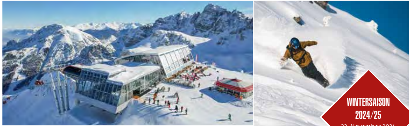
Panoramarestaurant Hoadl-Haus mit neuer Hoadlbahn

Willkommen im größten Skigebiet nahe Innsbruck