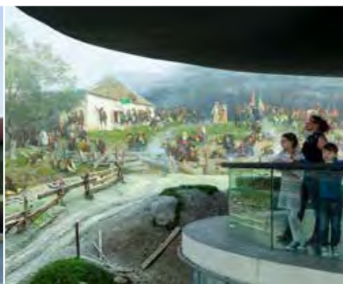
Innsbrucker Riesenrundgemälde © Mario Webhofer / W9 Studios