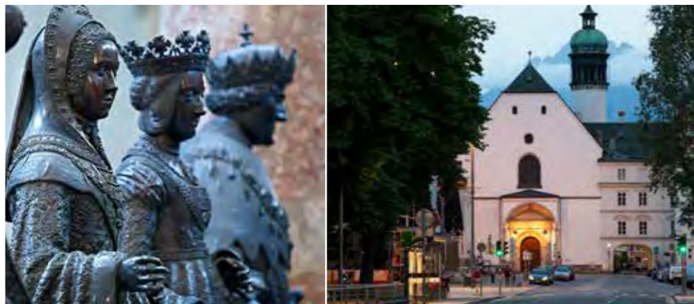
Die Schwarzen Mander