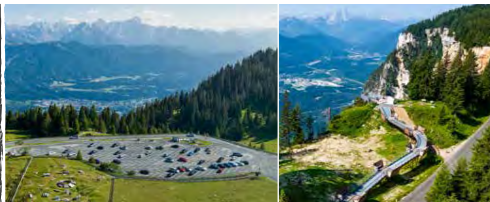
Neu: Villacher Alpenstraße Skywalk Rote Wand

Die Villacher Alpenstraße führt Besucherinnen und Besucher tief hinein in Kärntens ältestes Naturschutzgebiet.