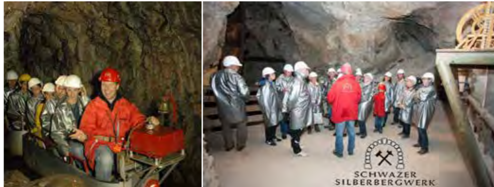
Faszinierende Einblicke in die bedeutende Rolle von Schwaz zur Zeit des Mittelalters

Die spannende Zeitreise ins auslaufende Mittelalter beginnt mit der Fahrt auf einer Grubenbahn 800 Meter durch den im Jahre 1491 angeschlagenen Sigmund-Erbstollen. Lassen Sie sich entführen in die sagemwobene Vergangenheit des Silberbergbaus in Schwaz und begeben Sie sich mit einem unserer Bergwerksführer/innen auf die Spuren der Schwazer Bergknappen!