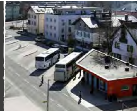
Busterminal Nonntal

ONLINE-BUCHUNGSSYSTEM Die Reisebusterminals Nonntal und Paris-Lodron sind beim Besuch der historischen Salzburger Altstadt für den Aus- und Einstieg der Fahrgäste vorab online zu reservieren.