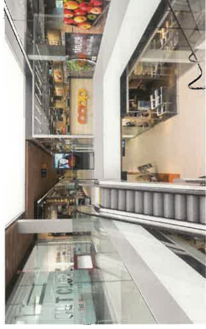
24 Shops und Restaurant bieten den Reisenden ein Shopping-Erlebnis.

Infos unter: shopping-raststaette.ch/w-bus