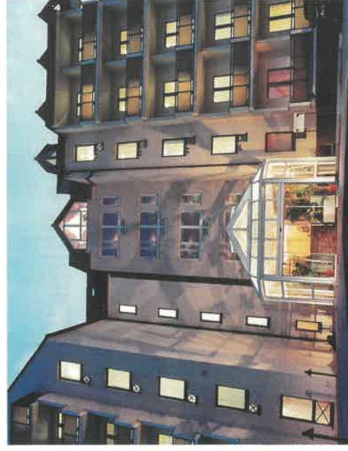
Das Morada Hotel Gothaer Hof.

men alle relevanten Informationen, Kontakte und auch eine Merkliste mit allen relevanten Infos.“ Alternativ können auch spezielle Angebote wie Kombitickets, Sonderführungen, Veranstaltungen gesucht werden. Am Ende findet der Reiseveranstalter immer eine Liste mit Angeboten, Ansprechpartnern, Gruppenpreise, Lage und Ausstattung.