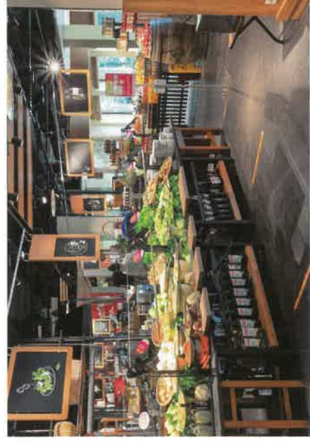
Frische Produkte aus der Region und darüber hinaus in der Raststätte.

Auf der Webseite können sich Busunternehmer für W-Bus anmelden